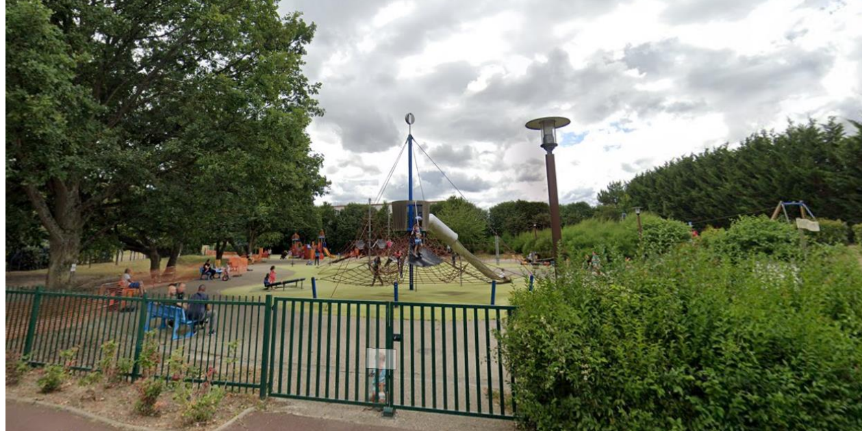
Aire de jeux Jacques Cartier (Elancourt)