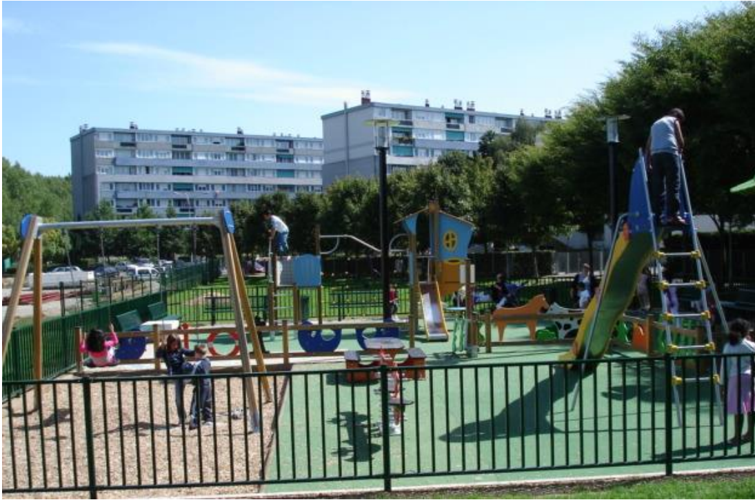
Aire de jeux Thorez (Trappes)