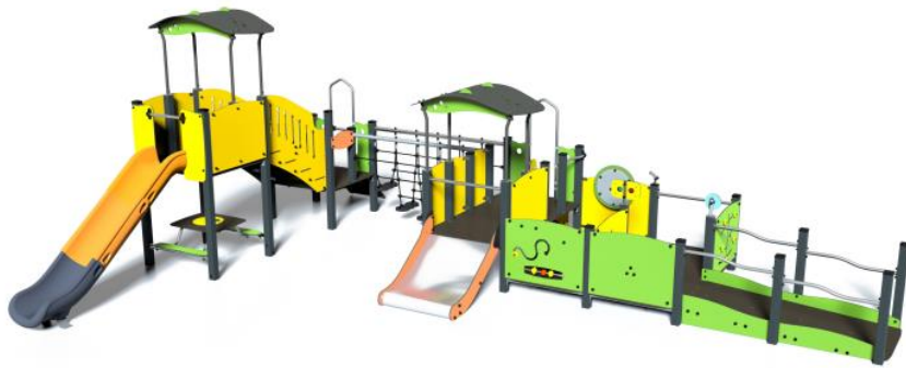
Exemples de jeux