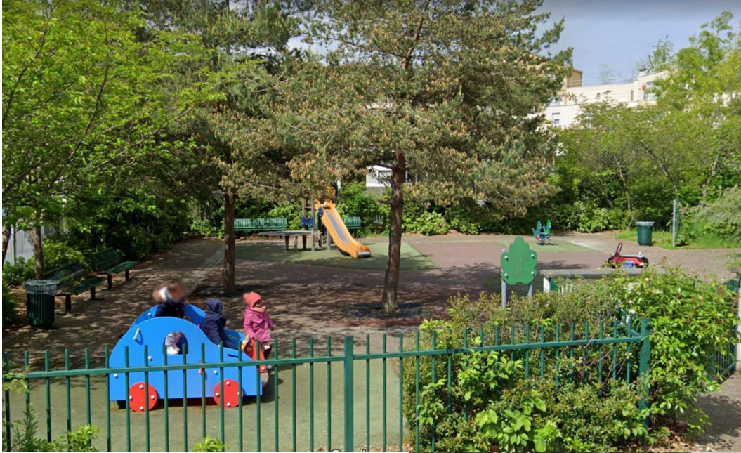
Aire de jeux rue Ronsard (Trappes)